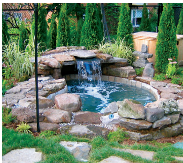
Piscine Futura par Trévi, trevi.com Spa creusé par ECOSPA, spapiscinecreuse.ca Mini piscine par Piscinelle (France), piscinelle.com Spa collection Urbaine par Aqua innovation, aquainnovation.ca